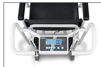
Großes, hinterleuchtetes LCD-Display, Ziffernhöhe 25 mm