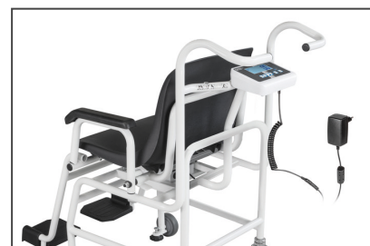
Netzadapter extern, serienmäßig, mit Zugentlastung und Trennstecker zur Schonung der Stromversorgungsbauteile

Diese Stuhlwaage ist das ideale Messinstrument für die Altenpflege und Paramedizin, einschließlich Wiegungen im adipösen Bereich bis 250 kg.