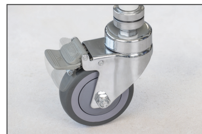
Fahrbare Ausführung mit zwei lenkbaren Rollen und besonders komfortablen Feststellbremsen hinten