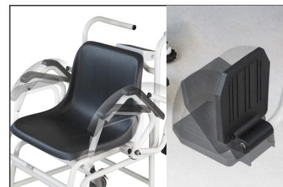
Zwei umklappbare Armlehnen und Fußstützen erleichtern das Platznehmen. Ideal für übergewichtige Patienten oder zum barrierefreien Umsetzen z. B. vom Bett auf die Stuhlwaage